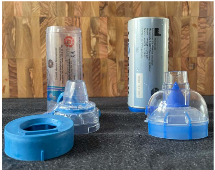
Zur Reinigung sollte die Inhalierhilfe mit Wasser ausgespült und zum Trocknen aufgestellt werden.

Bei Erstgebrauch und nach jeder Reinigung sollte ein Sprühstoß des Medikaments in die Inhalierhilfe gegeben werden, um die Wände zu benetzen („Primen“ des Spacers). Dieser Sprühstoß sollte dort verbleiben, also nicht eingeatmet werden.